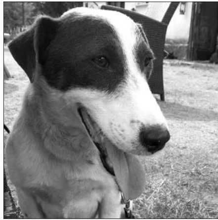
Happy: 2 év körüli ivartalanított kan kutya. Nagyon kedves barátságos, kutyákkal, macskákkal is egyaránt kijön.

A kutyák örökbe fogadásuk esetén az Argos Kutyaiskola Kecskemét illetve Lakitelek tanfolyamain díjmentesen részt vehetnek. Örökbe fogadási szándék esetén + 36 20 617-2670 es számon, vagy az argosallatvedo@gmail.com címen lehet jelentkezni.