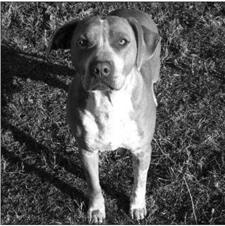
Panka: 3-4 év körüli ivartalanított szuka. Nagyon barátságos, kutyákkal jól kijön, a macskákat nem szereti.